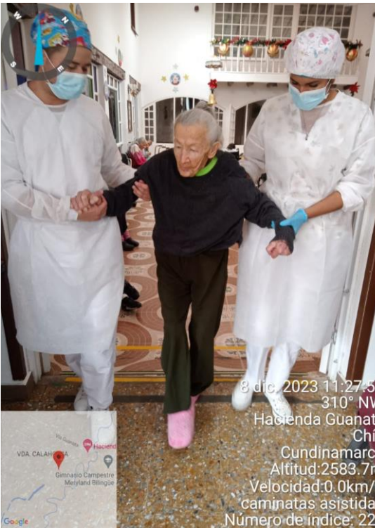
8 dic. 2023 11:27:52 310° NW Hacienda Guanata Chía Cundinamarca Altitud:2583.7m Velocidad:0.0km/h caminatas asistidas Número de índice: 223