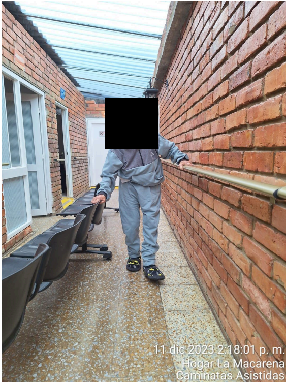
11 dic 2023 2:18:01 p. m. Hogar La Macarena Caminatas Asistidas