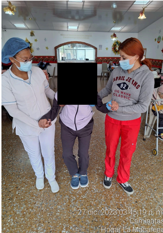
27 dic. 2023 03:45:19 p. m. Caminatas Hogar La Macarena