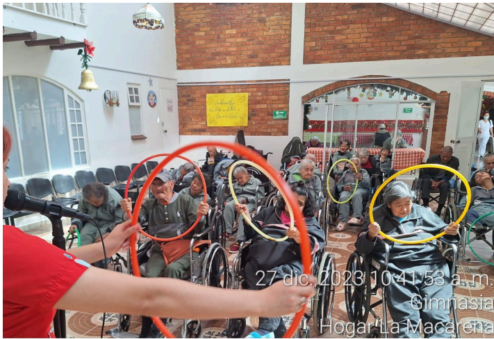
27 dic. 2023 10:41:53 a. m. Gimnasia Hogar La Macarena