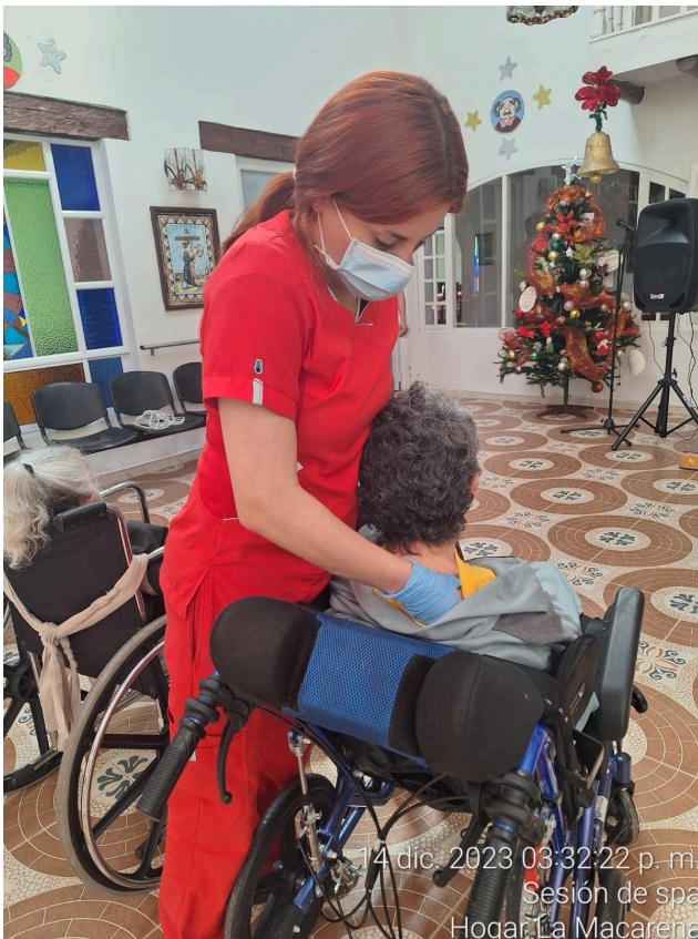
14 dic. 2023 03:32:22 p. m. Sesión de spa Hogar La Macarena