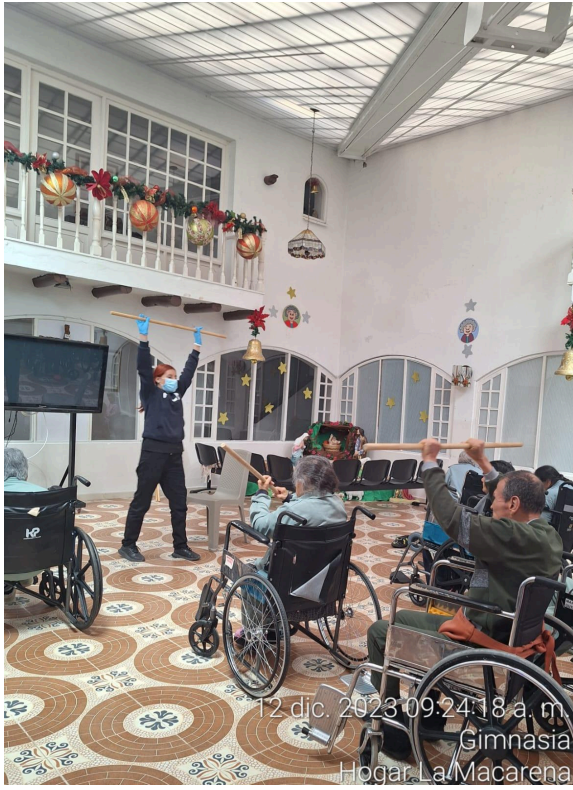
12 dic. 2023 09:24:18 a. m. Gimnasia Hogar La Macarena