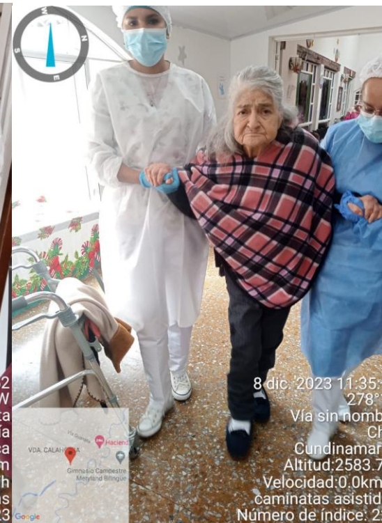
8 dic. 2023 11:35:55 278° W Vía sin nombre Chía Cundinamarca Altitud:2583.7m Velocidad:0.0km/h caminatas asistidas Número de índice: 224