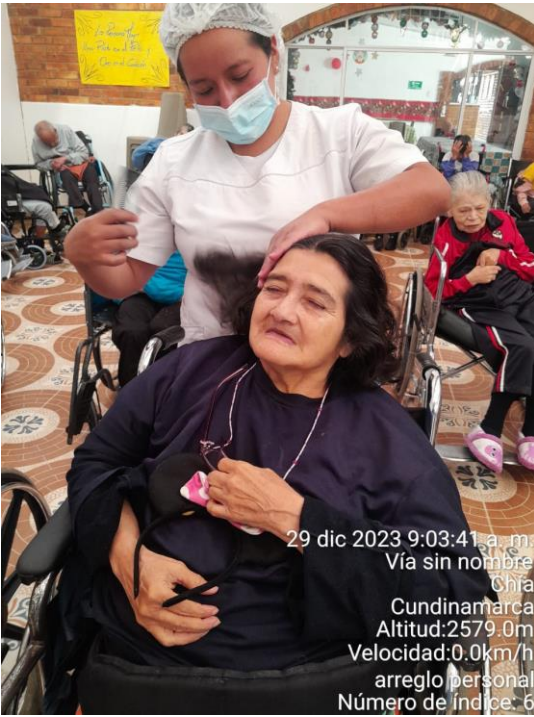
29 dic 2023 9:03:41 a. m. Vía sin nombre Chía Cundinamarca Altitud:2579.0m Velocidad:0.0km/h arreglo personal Número de índice: 6