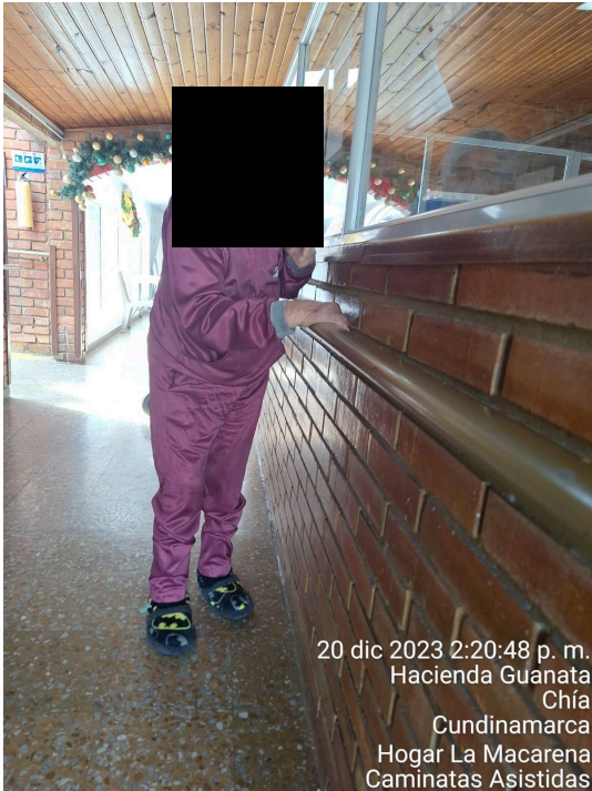
20 dic 2023 2:20:48 p. m. Hacienda Guanata Chía Cundinamarca Hogar La Macarena Caminatas Asistidas