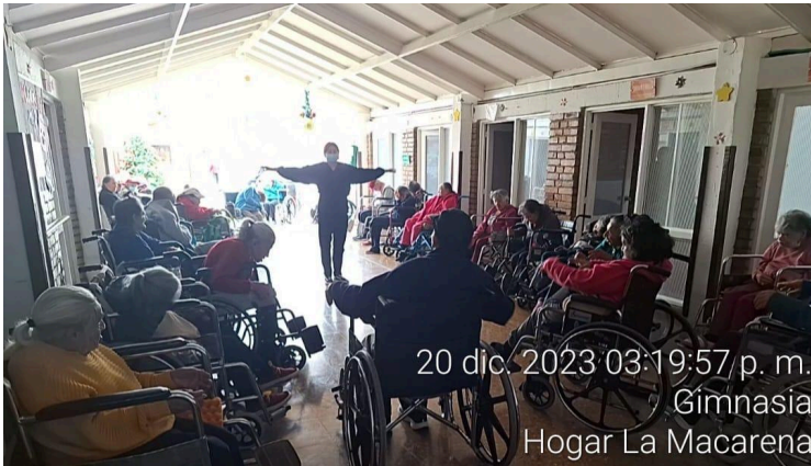
20 dic 2023 03:19:57 p. m. Gimnasia Hogar La Macarena