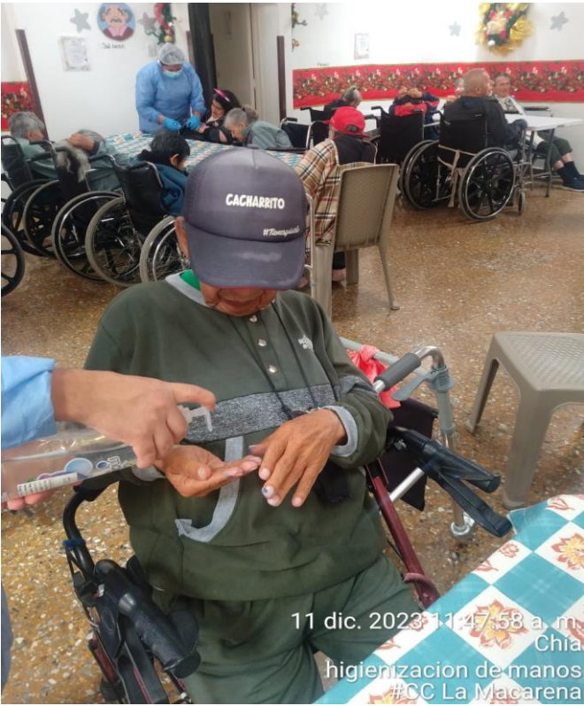
11 dic. 2023 11:47:58 a. m. Chia higienización de manos #CC La Macarena