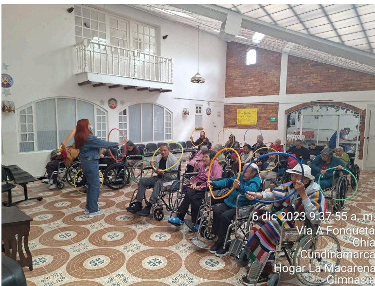
6 dic 2023 9:37:55 a. m. Vía A Fonquetá Chía Cundinamarca Hogar La Macarena Gimnasia