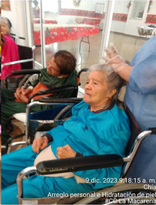
9 dic. 2023 9:18:15 a. m. Chía Arreglo personal e Hidratación de piel #CC La Macarena