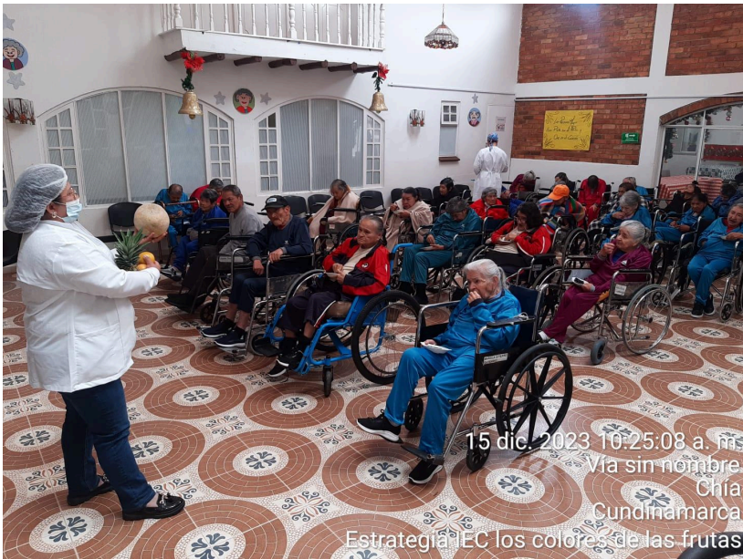
15 dic. 2023 10:25:08 a. m. Vía sin nombre Chía Cundinamarca Estrategia IEC los colores de las frutas