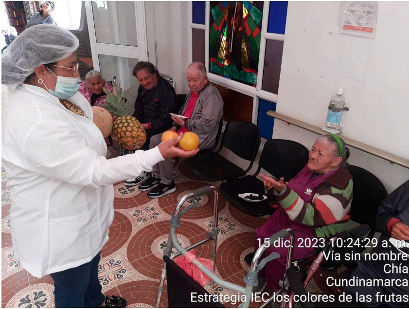
15 dic. 2023 10:24:29 a. m. Vía sin nombre Chía Cundinamarca Estrategia IEC los colores de las frutas