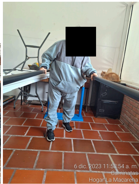
6 dic. 2023 11:58:54 a. m. Caminatas Hogar La Macarena